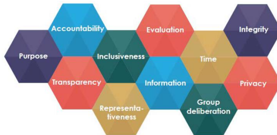
Figure 5.1. Good practice principles for deliberative processes for public decision making

OECD (2020), Innovative Citizen Participation and New Democratic Institutions: Catching the Deliberative Wave , OECD Publishing, Paris, https://doi.org/10.1787/339306da-en .