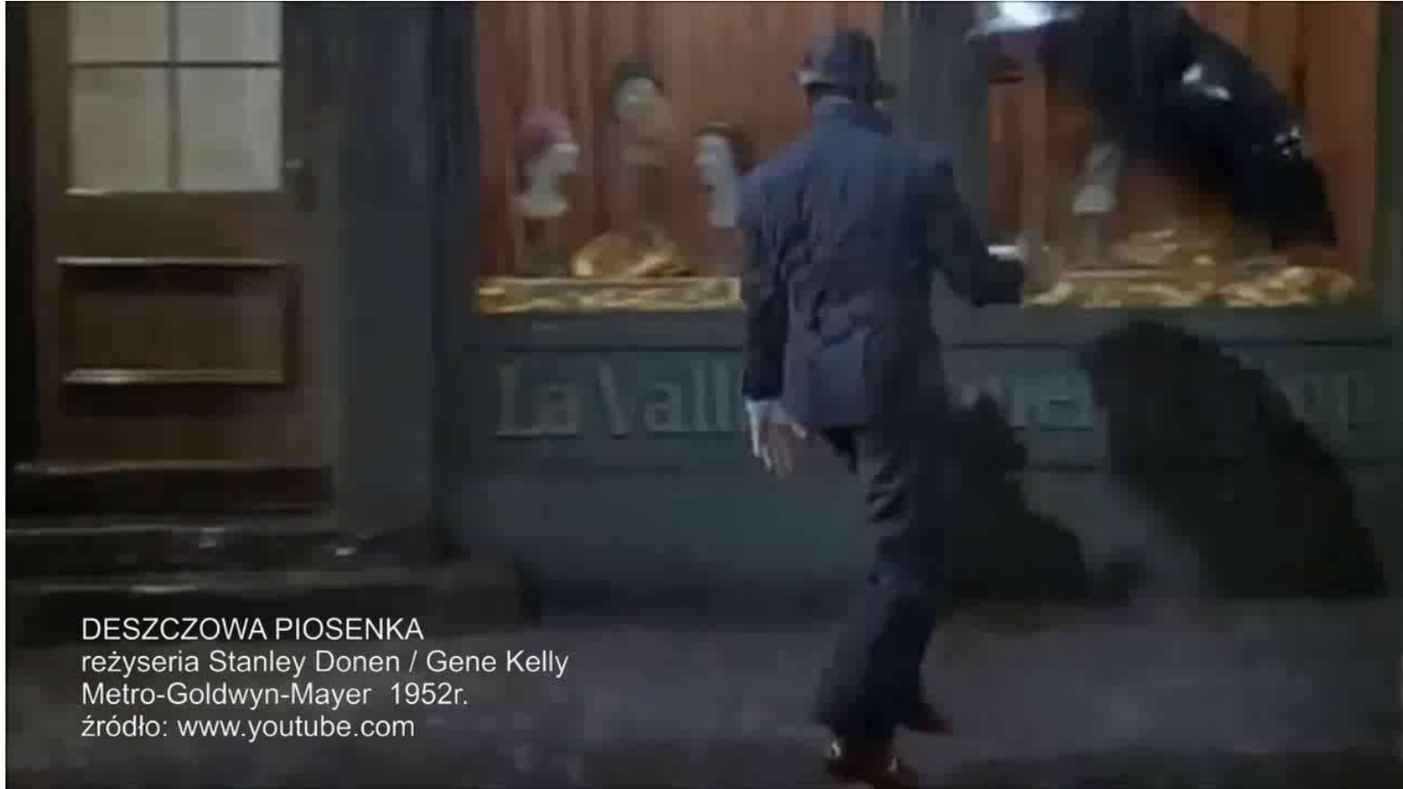
DESZCZOWA PIOSENKA reżyseria Stanley Donen / Gene Kelly Metro-Goldwyn-Mayer 1952r.